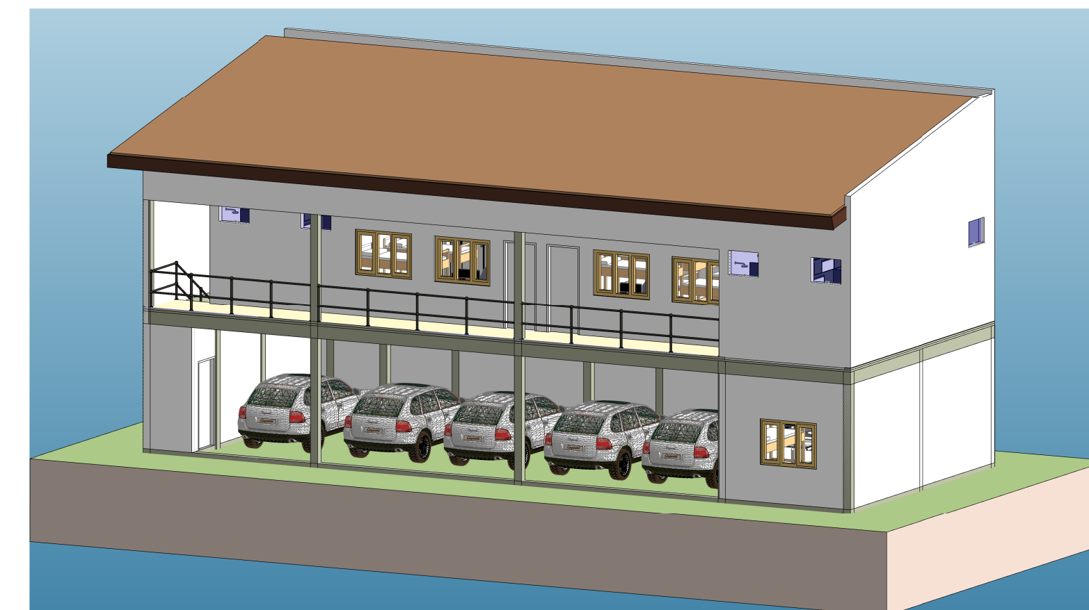
3 3D - 1 ESCALA -