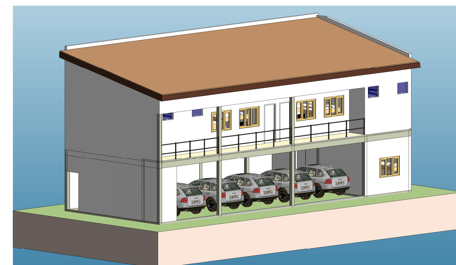
4 3D - 2 ESCALA -